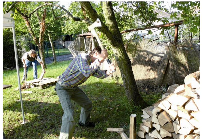
Quelles que soient vos compétences, votre implication est la bienvenue !