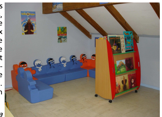
Le « coin » Albums de notre nouvelle bibliothèque...