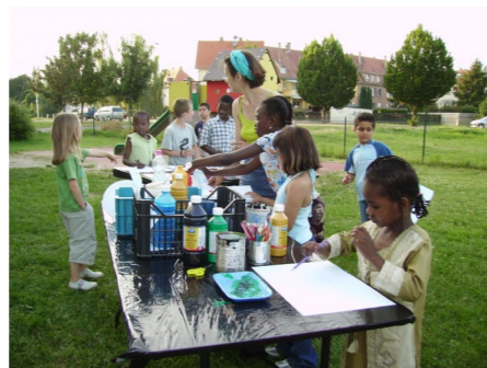
Atelier fresque collective