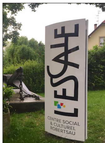
La signalétique de l'Escale a pris un sérieux « coup de jeune »

Pour ceux qui étaient présents le 3 juin dernier, lors de la semaine des fêtes de l'Escale et du dévoilement de notre nouvelle identité visuelle, les concepteurs de celle-ci, de