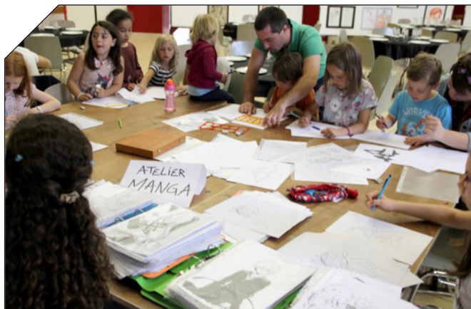
L'atelier Manga proposé lors des Fête(s) de l'Escale a connu un franc succès