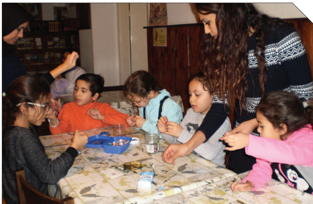
Veillée du week-end Z'animé à la neige proposé l'hiver dernier dans le cadre des activités du pôle familles