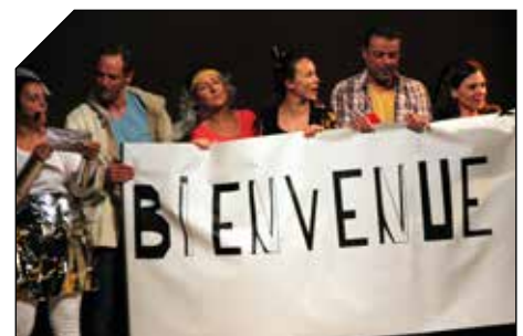
Pour le final, une chanson « Nous sommes l'Escale » créée pour l'occasion était entonnée sur l'air de « We Are The World »