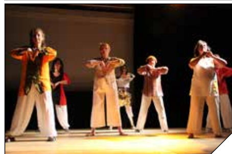
Parmi les étapes : Découvrir le DYNAMISME sur une chorégraphie très « Toutouyoutou » en 1985 et l'OUVERTURE D'ESPRIT en 1977 lors d'un atelier Qi Gong sentant bon le patchouli !

La découverte de mots clés leur permet d'avancer dans leur quête. Il passeront ainsi successivement à l'accueil de loisirs à l'occasion d'une sortie organisée en 2027, puis en 2033 où ils sont téléportés au premier cours de Flamenco de la saison. Retour en 1983, sur des airs de Cindy Lauper avec le cours de Modern Jazz puis en 2017 pour une valse lente d'un thé dansant. Les voyageurs remonteront ensuite en 1977 pour un cours de Qi Gong am-