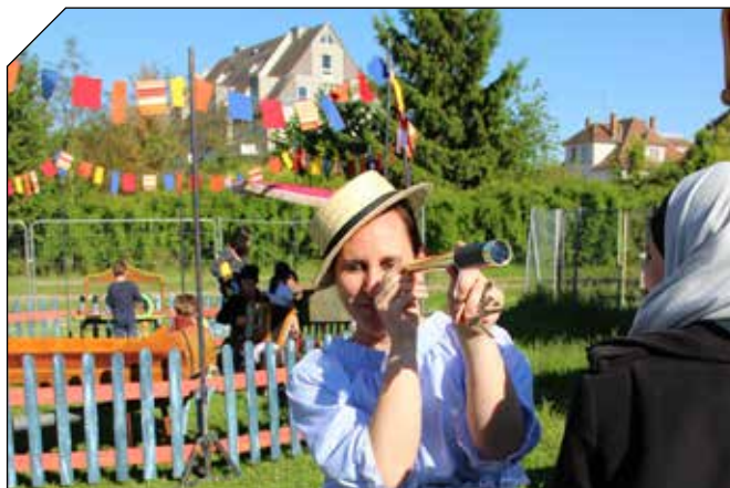
Ambiance Fête Foraine 1900 réussie dans le jardin de l'Escale...

Alors un grand merci à la présence chaleureuse des pa-