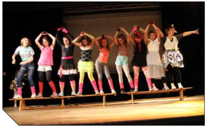
A base de « Ah Ouaiiiiis » les élèves de Modern Jazz des années 80 nous ont livré une chorégraphie déjantée et pleine de CRÉATIVITÉ.

De 1977 à 2057, de nombreuses haltes attendent nos aventuriers.