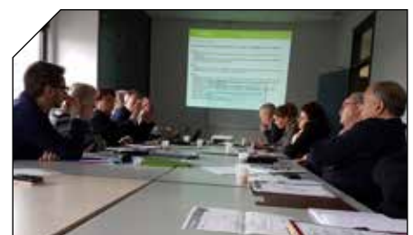
Réunion insertion où le projet de création d'un pôle insertion a été présenté