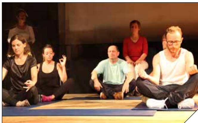
Le calme avant la tempête ! Une situation qui a traversé le temps à l'Escale, la rencontre entre les élèves de méditation et ceux de danse contemporaine...

« En 2057, la vie sur terre a considérablement changé (...) subsistent encore ici et là quelques vestiges de la civilisation passée : quelques salles du souvenir où l'on pratique le « sport » et où se croisent encore les humains, sont fréquentées par des nostalgiques nés avant la grande révolution. Ces espaces qui ont traversé le temps sont appelés CSC. »