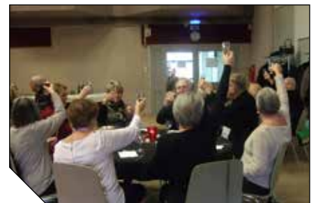
Repas de Noël du Bel Âge