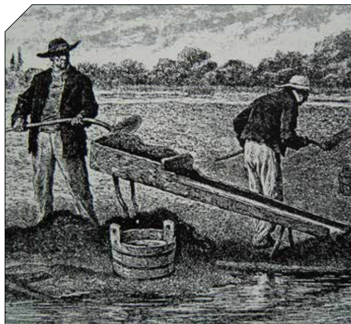
Orpailleurs alsaciens (gravure de Brabant d'après un dessin de Lix)