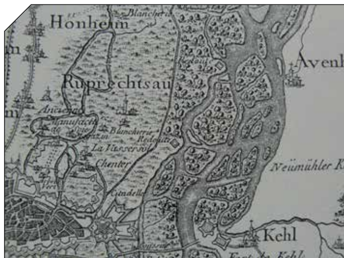
Extrait de la carte de Cassini

Avec un savoir transmis de père en fils, l'orpailleur recherche un placement sur les sables alluvionnaires réputés