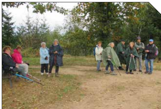
Balade à Durbach organisée à l'automne dernier

âge est édité par trimestre et est disponible sur notre site Internet ou à l'accueil.