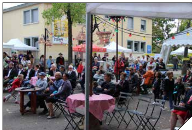
Malgré un temps froid et menaçant, le public était au rendez-vous de cette 8 ème édition !

... et la fête continue !!! : théâtre, rock, rap... prolongent ce voyage festif dans un mix