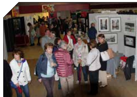
L'exposition accueillait 23 artistes plasticiens et 5 auteurs

En effet, les membres de Noa Noa Tahiti entament un