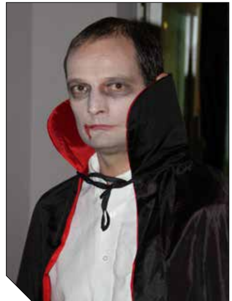
Le Comte Dracula nous fera-t-il l'horreur de sa présence ?

Un buffet hanté vous sera proposé (petite restauration payante) cookies fantômes, cocktail sanglant et pizza de vers de terre vous feront trembler de peur.