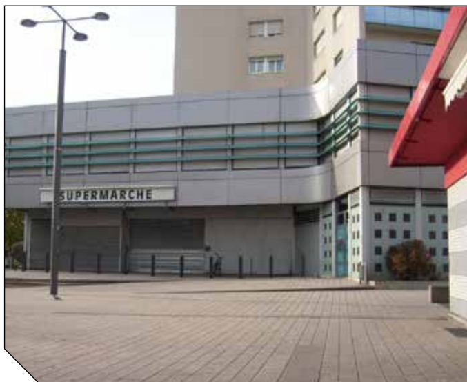
Le Foyer des Loisirs comprend plusieurs salles d'activités dont une salle des fêtes au 1 er étage de la Tour Schwab, 42 rue de l'ill à la Robertsau-Cité de l'ill.