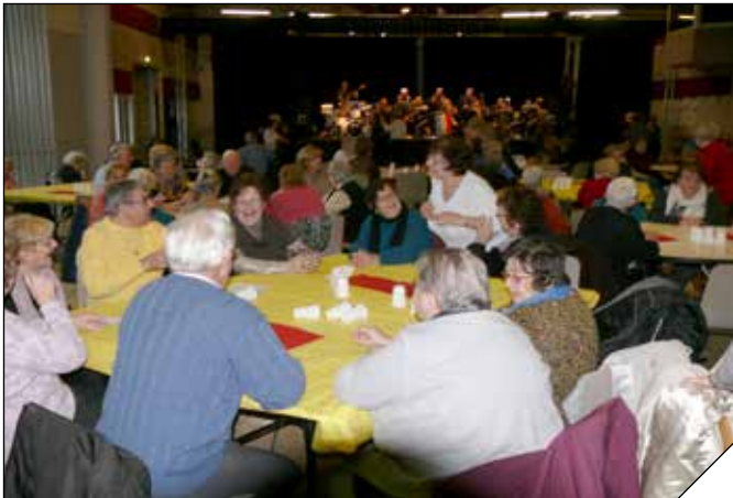
Une partie du Club des Aînés de la Cité de l'III en « sortie » à l'Escale lors du bal organisé chaque année à la Robertsau au moment de l'épiphanie...

Créé en 1970 sous l'appellation juridique de « l'Association pour le Soutien des Personnes Âgées de la Cité de l'III », il aura en effet 50 ans en 2020. L'association conduit sa mission avec tout l'enthousiasme de son bel âge sous le nom plus connu de Club des Aînés.