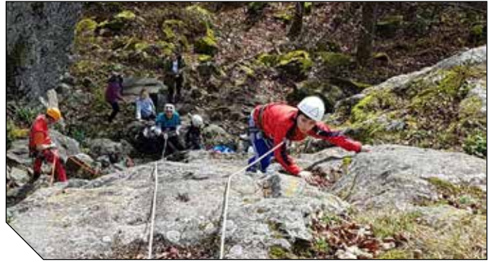
Initiation à l'escalade avec le Club Alpin Français

Durant ce week-end, nous avons également proposé aux participants de préparer les repas en communs. Ce qui a