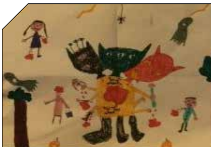
Une des créatures repoussante primée lors de ce concours