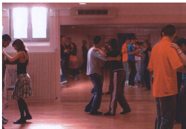
Stage Salsa à Noël

(organisés au courant des vacances scolaires de la