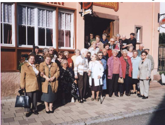
La dernière sortie du Club le 26 novembre 2006. Une trentaine de membres ont participé à la « Cochonaille » à Hatten.