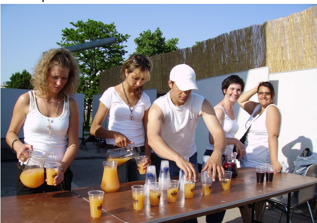
Les mamans l'adoraient, ses collègues aussi... un homme toujours très bien entouré !