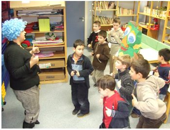
Cours de coiffure lors des vacances de Noël ?

Inscriptions aux vacances de février à partir du 31 janvier: