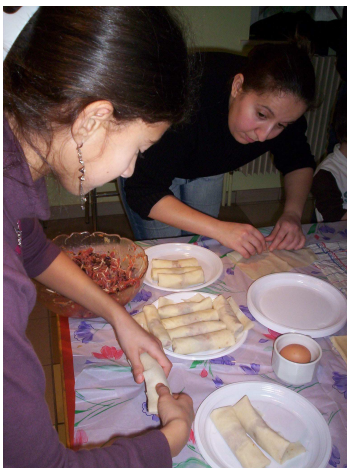
Les élèves sont appliquées, forcément avec les meilleures cuisinières de l'Escale...