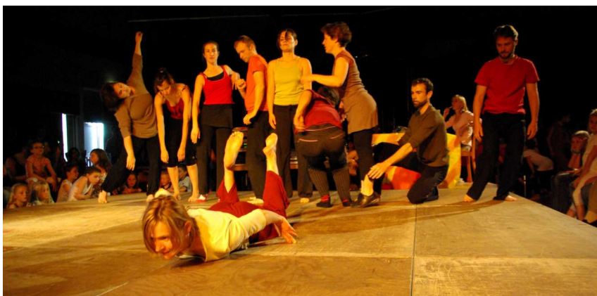
Les participants à l'atelier danse contemporaine lors de la Fête de l'Escale

De nombreuses actions concrètes sont prévues depuis la rentrée. Certaines sont nouvelles, d'autres sont dans la continuité de ce que nous faisons déjà précédemment.