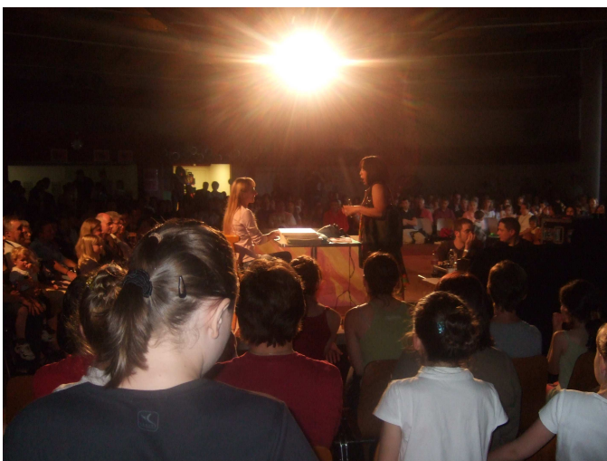
« C'était vraiment SUPER !!! »