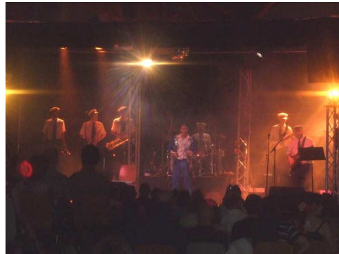
Rien ne va plus, 15h15 passe à 21h00 !!!

Ensuite, c'est la grande répartition des plats. Les habitants ont joué le jeu jusqu'au bout. Beaucoup se sont vraiment décarcassés et les plats préparés réjouissent les papilles. Les invités se retrouvent à l'intérieur, à l'extérieur et, en musique (celle de Ratere No Tahiti),