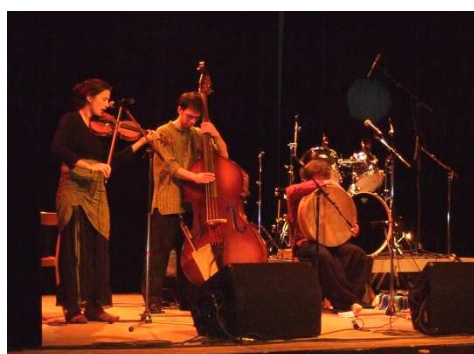
L'Ensemble du Prince Oreille (musique du monde)

Ce sont 400 personnes qui se sont déplacées pour découvrir les 10 groupes ou chanteurs qui se sont succédés tout au long de la nuit.