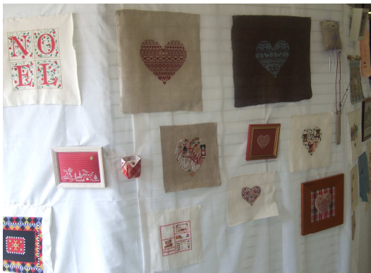
Réalisations des participants à l'atelier, présentées lors de l'exposition Arts'Mateurs.

Tous les mardis soir de 20 h à 22 h hors vacances scolaires nous nous retrouvons pour broder, échanger