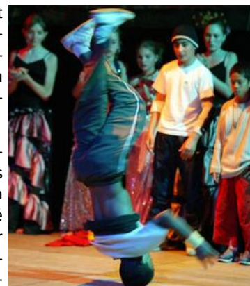
Danseur hip-hop « Illusion Crew »