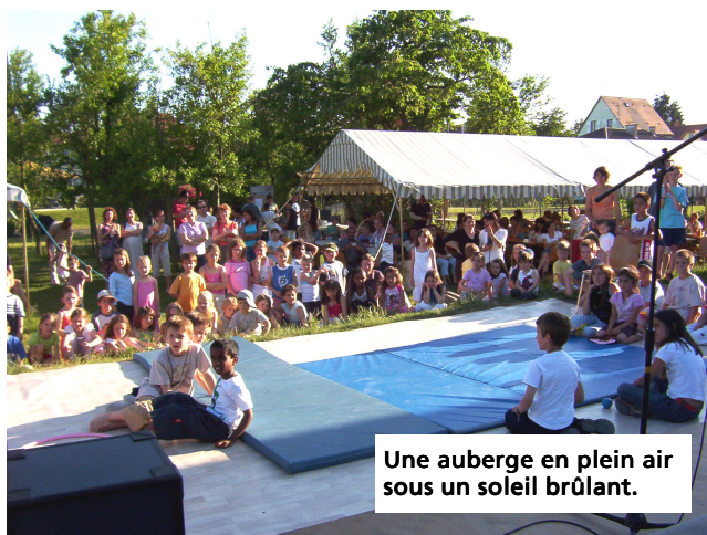
Une auberge en plein air sous un soleil brûlant.