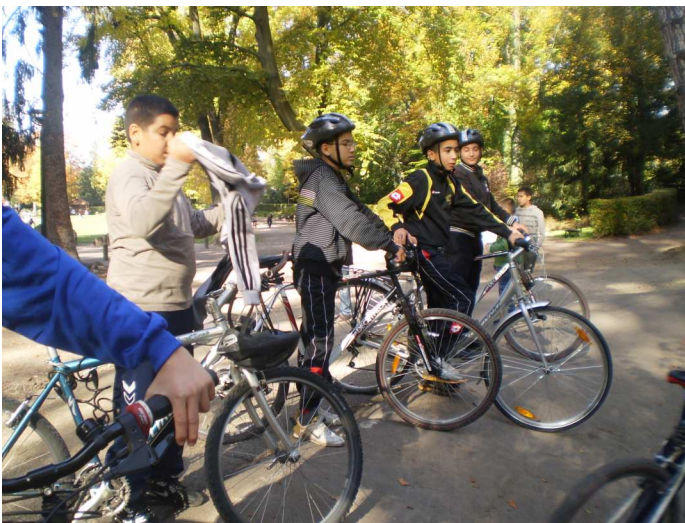
Sortie vélo à l'Orangerie pendant les vacances de la Toussaint