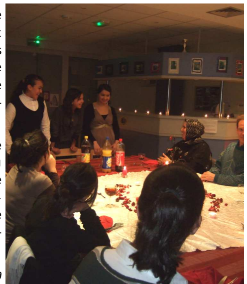
Ambiance, décoration, saveurs, rien n'a échappé à l'impitoyable jury...