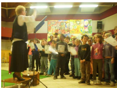
Chants avec les Chœurs de l'III