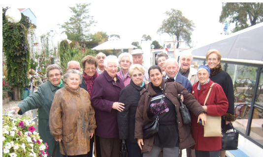
Le Club des Amis Retraités en balade

Le copieux repas, passant d'un pâté en croûte avec du taboulé, des bouchées à la reine accompagnées de pâtes, suivi de fromage et d'une part de tarte aux fruits, s'est déroulé