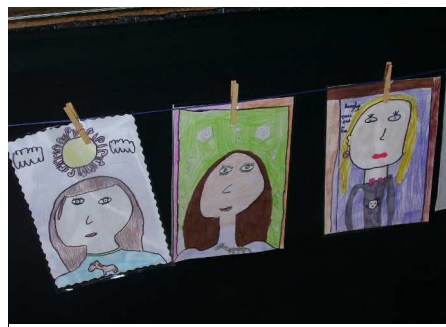
Œuvres exposées lors de l'exposition Arts'Mateurs en 2009

d'Administration (Amateurs... contactez-nous).