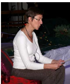
Lecture du conte de la Saint Nicolas... en sa présence !

Comme par enchantement, celui-ci, accompagné du père fouettard a offert à tous les convives friandises,