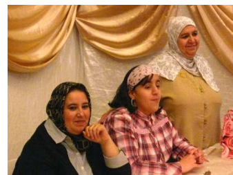
Séance de dédicaces..

« Les Contes de la Doller » sont disponibles à l'accueil de l'Escale.