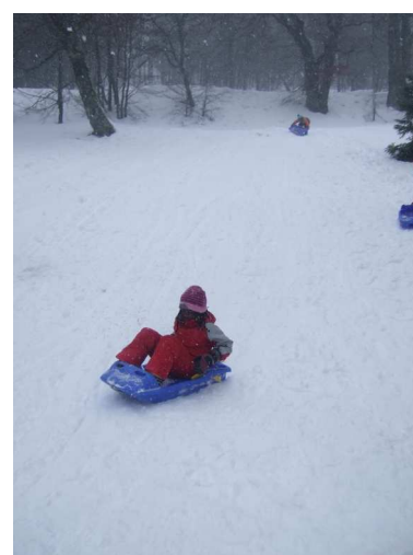
Certains voulaient passer la nuit dehors...