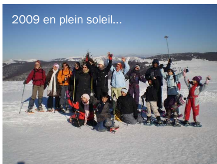
2009 en plein soleil...