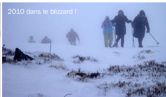
2010 dans le blizzard !