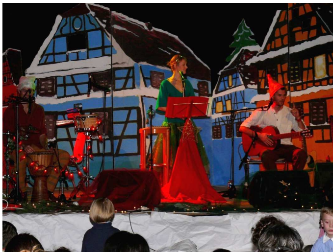
Les lutins du Père Noël ont trouvé un peu de temps pour nous enchanter avec des musiques de Noël revisitées...

ses, chocolat et vin chaud pour les grands enfants.