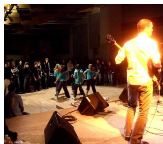
Le Gombo's Club et ses danseurs !