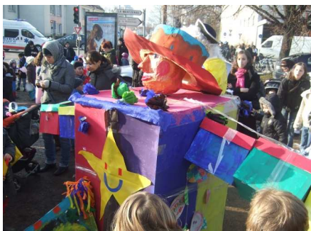
Les dernières heures du bonhomme hiver

Une fois les morceaux assemblés, c'est en fanfare que nous avons rejoint le siège de l'Escale afin d'y brûler le bonhomme comme le veut la tradition.