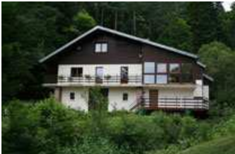
Le gîte qui nous accueillera ce week-end...

C'est ce que l'Escale vous propose le samedi et di-