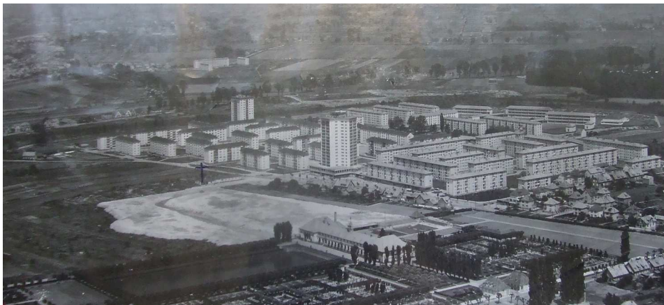
La Cité de l'III vue du ciel