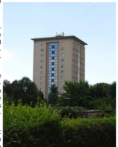
La Tour KAH, construite à la même époque que la tour Schwab

En 1975 fut construite au 18 rue de la Doller la "résidence des