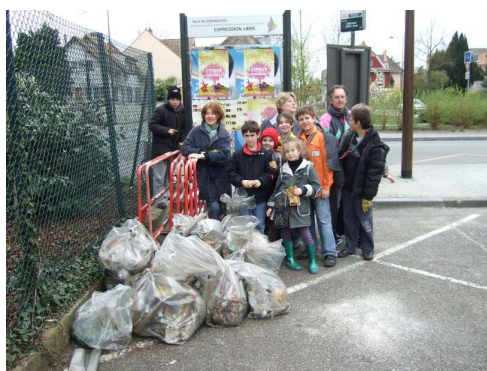
2008 avait malheureusement connu une bonne récolte !

déchetterie de la Robertsau est organisée de 14h à 15h30. La journée se terminera par un goûter convivial lors duquel nous pourrons échanger sur des questions liées à notre environnement.