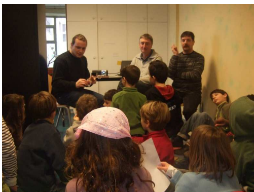
Les éducateurs du SISES ont pu répondre aux nombreuses questions des enfants...