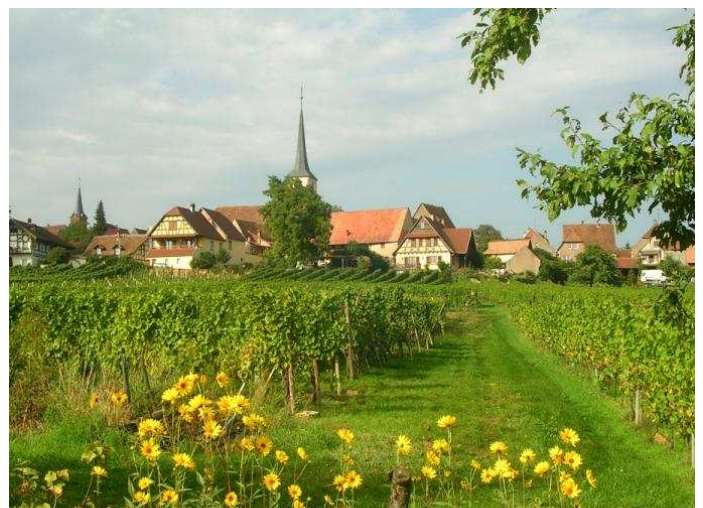
Un samedi z'animé en direction des vignes, sur la piste des châtaignes !