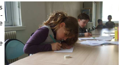
Les enfants illustrent et racontent leurs souvenirs de ces journées gourmandes

Les enfants de l'Accueil de Loisirs se souviennent de l'année passée :