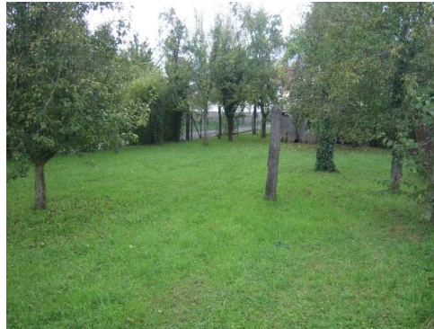
Le verger situé dans le jardin de l'Escale a besoin d'un rafraîchissement !

Partant de ce constat, j'ai eu l'idée de planter cet autom-