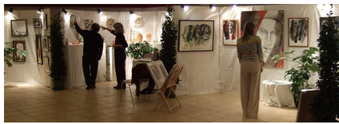
La dernière édition avait eu lieu en 2007