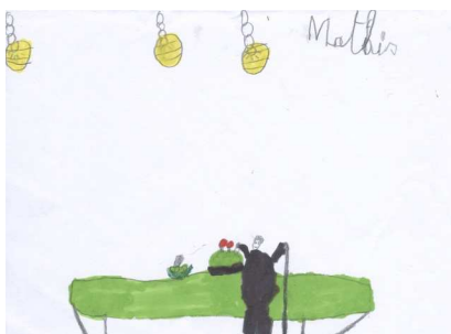
Illustration des ateliers pâtisseries par Mathis

« On a mangé une tarte aux tomates et fromage de chèvre. » Elias