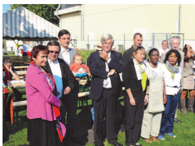
Inauguration en musique avec l'orchestre de l'harmonie Caecilia