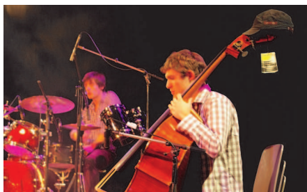
Le groupe « Les Sphinxwell » lors de l'édition 2010

musicaux du quartier de la Robertsau et de ses alentours et par ailleurs de tisser