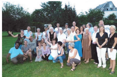
Photo réunissant une partie des bénévoles et salariés de l'Escale

importante. Aujourd'hui une vingtaine de bénévoles font partie de ce réseau.