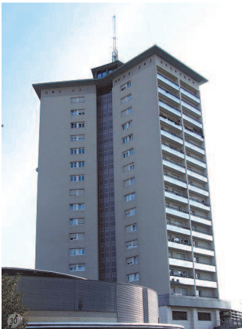
L'accès à la salle judo se fait par l'escalier situé 2 rue de la Doller

Fin juin 2011, nous avons décidé de quitter le collège Boecklin dont le coût annuel du gymnase important, augmentait sensiblement la participation des usagers. Cette initiative répondait à une demande des participants et du professeur de taekwondo qui souhaitaient que le coût de l'activité soit diminué.