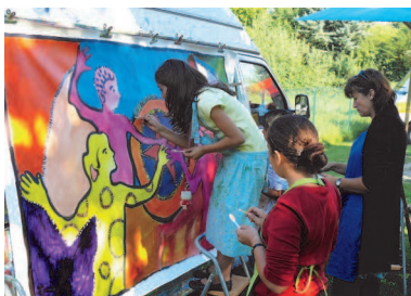
Réalisation d'une fresque collective avec l'Atelier artistique Ambulant