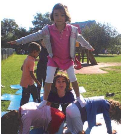
Les répétitions circassiennes menaient bon train depuis déjà septembre !