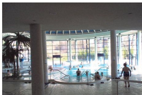
Les participants ne nous ont pas autorisés à insérer les photos du sauna...

Nous étions 16 participants à embarquer dans cette aventure aquatique mais heureusement aucun de nous n'a