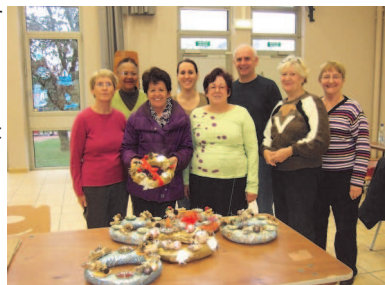
De nombreux ateliers chaque mois, en décembre « couronnes de l'Avent »