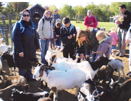
De bien belles biquettes qui ont failli se retrouver dans le jardin de l'Escale !

A l'espace des animaux de la ferme, nous avons assisté au