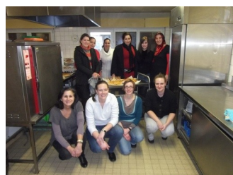
Fabrication des galettes des rois

Par la suite, nous avons organisé différentes actions permettant de récolter des fonds et de faire connaissance. Une vente de galettes des rois faites maison, un goûter crêpes, la réalisation du buffet de l'assemblée générale ont été autant d'occasions de rassembler le