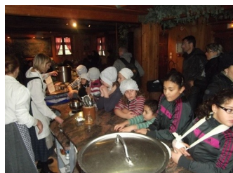
Sortie à l'écomusée

Tout d'abord une rencontre en octobre lors de la Fête de la Soupe organisée par le CSC A. Sorgus a permis lors