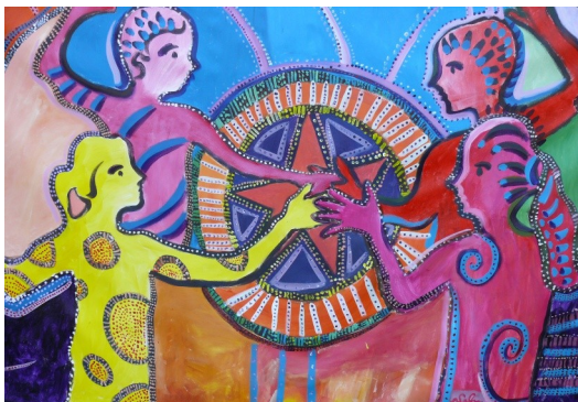
Détail d'une fresque collective réalisée par les participants lors de la précédente édition