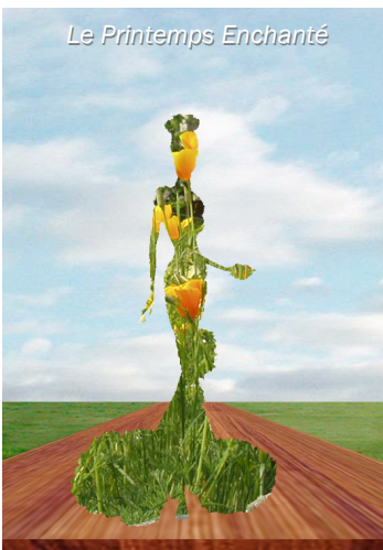
Le Printemps Enchanté