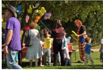
Retrouvez les photos de la fête sur le site de l'Escale www.csc-escale.net

Autre file d'attente également devant le stand de restauration où l'on pouvait déguster les fameuses tartes flambées, merguez et saucisses blanches, knacks et assiettes campagnardes ainsi que des gâteaux, faits maison, très appétissants. On pouvait se rafraîchir avec une bonne bière « Perle » blanche ou blonde (en toute modération), ou toute autre boisson.