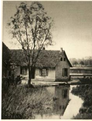
Ruprechtseu: Am Franzosenkanal

Bordées par les roseaux et les saules, les eaux claires, qui permettaient l'alimentation de la pièce d'eau du château Pourtalès, de petits étangs ou du bain public, ont disparu. Mme Obrecht rappelait dans un poème que "nos mères lavaient leur linge au lavoir. Non loin de là les paysans, en fin de journée, y venaient baigner leurs chevaux." Les jeunes y ont appris à nager, le canal a permis des