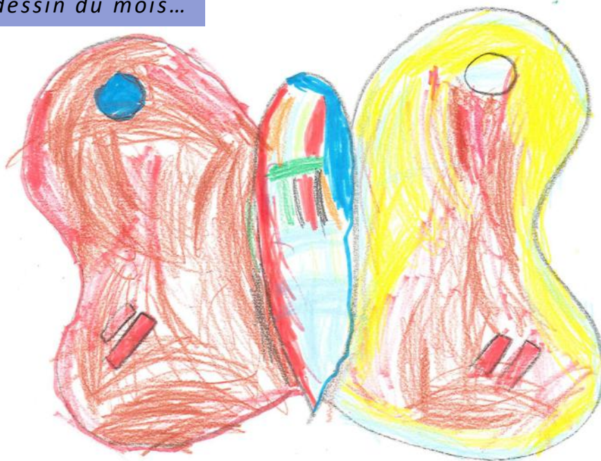
Anis, 4 ans, nous propose une version très joyeuse du papillon