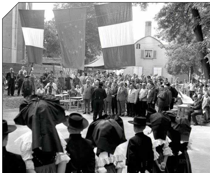
Inauguration du parc de la Petite Orangerie en 1967