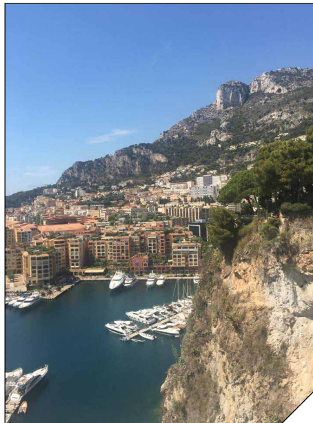
Excursion sur le rocher de la famille Grimaldi

des activités sportives comme du beach-volley, du football, de la pétanque, du tir à l'arc, du ping-pong, de l'aqua-gym. Nous avons aussi une biblio-