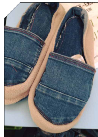
De l'art de réutiliser de vieux vêtements...