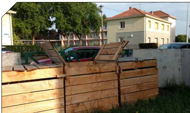
Notre site de compostage collectif est situé à l'entrée du 40 rue de la Doller.

Nous sommes encore à des années lumières d'une société zéro déchet et cela ne pourra se faire sans turbulences. Sans vouloir tirer des plans sur la comète, nous espérons que ces petites actions permettront de grandes révolutions !