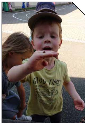
Après-midi domptage de coccinelles à l'ALM...

Mercredi 12 juillet, première escale aux Jardin des Deux