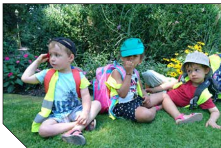
Escale à l'Orangerie, détendus sur l'herbe et, ci-dessous, le groupe prêt à partir pour de nouvelles aventures...