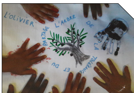
L'olivier, arbre de la tolérance et du partage...