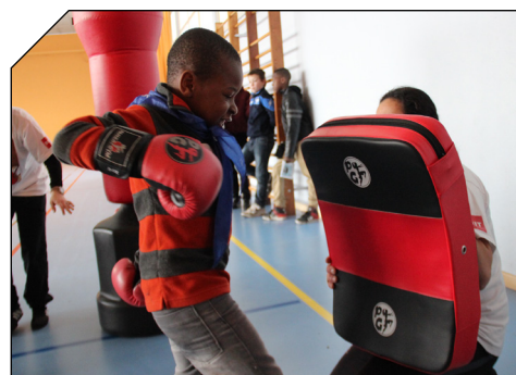
Atelier boxe lors de l'édition 2016