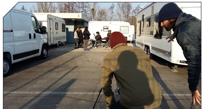
Jour de tournage sur l'aire des gens du voyage à Schiltigheim

Ils partageront leur quotidien en présence des artistes marocains et mettront en commun leurs compétences pour réaliser un court métrage de grande qualité, car l'oeuvre audio-visuelle en question sera proposée dans différents festivals du court-métrage, en