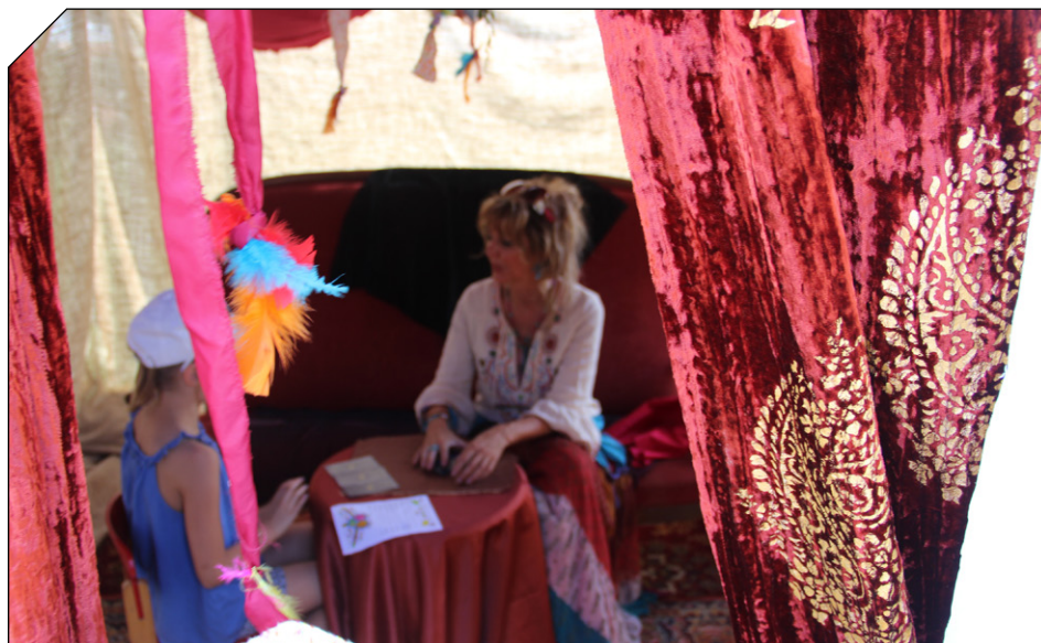
En cas de baisse de subventions, nous avons déjà trouvé une reconversion pour notre animatrice cartomancienne !