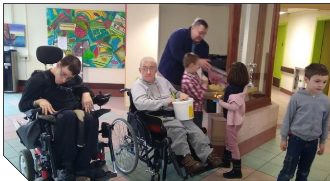
Une chasse aux œufs, prétexte à une rencontre entre les résidents de la Maison Oberkirch et les enfants de nos Accueils de Loisirs...

Le moment tant attendu survenait aux alentours de 15h00. Une course haletante