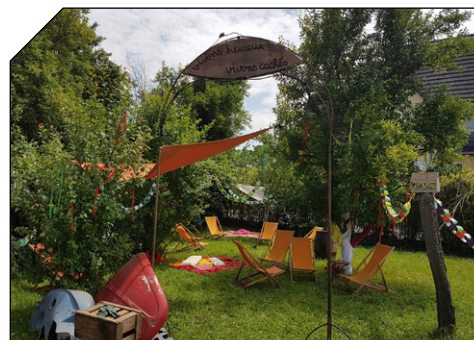
L'espace détente pour se reposer entre deux animations...

Le parcours de l'effroi faisait parti des