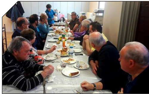
Rencontre du mois d'avril à la paroisse Ste Bernadette...

structure du quartier pour comprendre « qui fait quoi » et avec quels moyens le fait-on, c'est essentiellement un moment privilégié d'échange où chacun va expliquer ses axes de travail et ses projets.