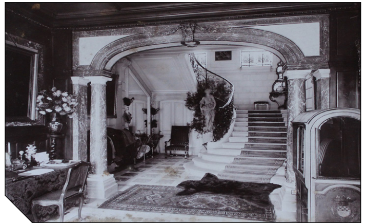
Petit jeu d'observation qui nous fera voyager du passé au présent en entrant dans le vestibule du château.

Pour illustrer ce voyage dans le passé, citons une description de l'entrée « Sous la marquise de droite, la porte s'ouvre sur une vaste antichambre de belle allure - dont une partie du fond est occupée par le grand escalier - dans laquelle se trouve une admirable statue du XVIII ème siècle et où j'admire une délicieuse chaise à porteur du XVII ème . A droite, est la porte donnant accès à