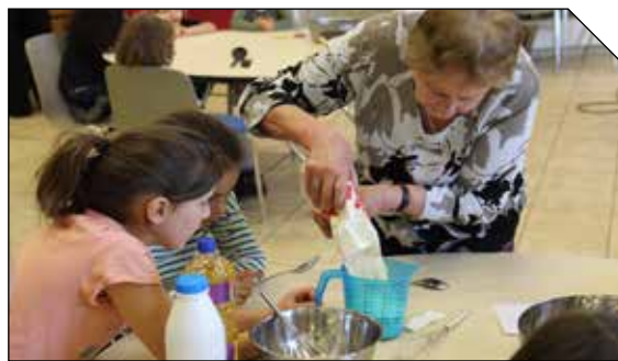
Une bénévole chez les Mamies Pâtisseries

Que le milieu associatif soit si représenté est historiquement logique (Association des Paralysés de France, Association Française contre les Myopathies...) car il est d'origine le lieu