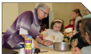
Une bénévole chez les Mamies Pâtisseries